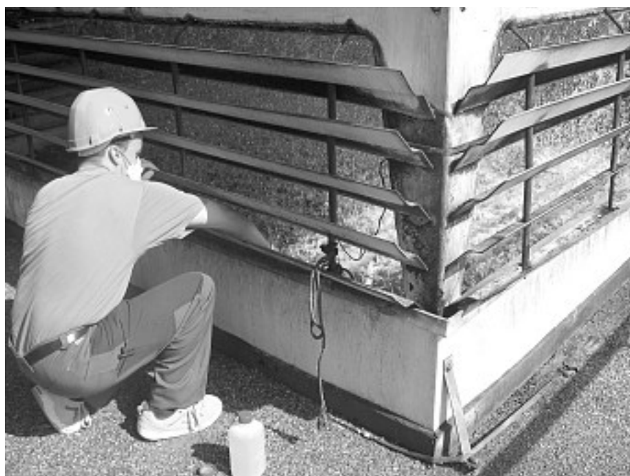
Figure 1. Prélèvement dans une tour aéro-réfrigérante

Pour faute : Les articles 1382 et 1383 du Code civil responsabilisent les exploitants ne respectant pas la législation.